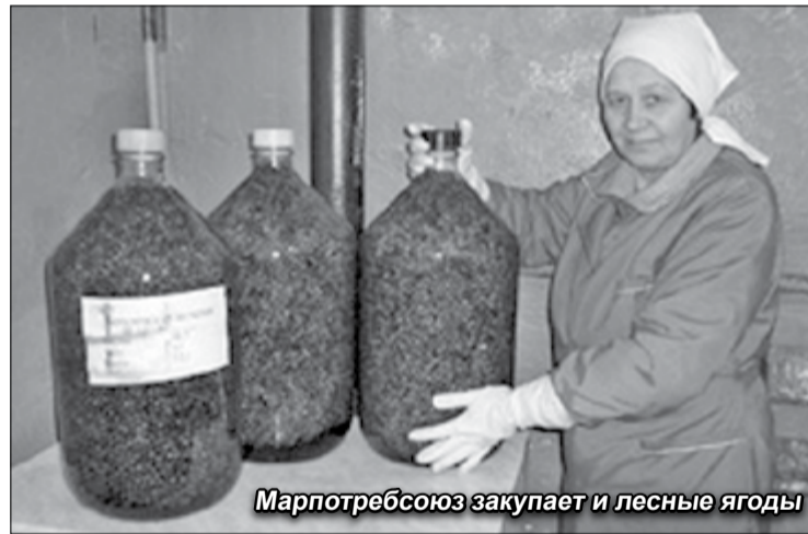
Марпотребсоюз закупает и лесные ягоды

Кстати, на экономическом форуме «Время возможностей», который проходил в Йошкар-Оле в августе, продегустировать новые напитки от Марпотребсоюза выстраивалась очередь.